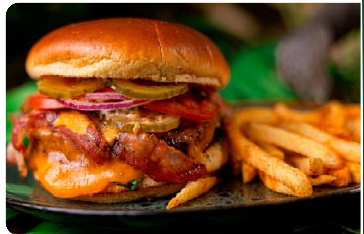
CLASSIC SPINOSAURUS BURGER

La hamburguesa insignia de la casa. Carne de res, chorizo y baño de cheddar fundido con tocino. ¡Una erupción de sabor! 119