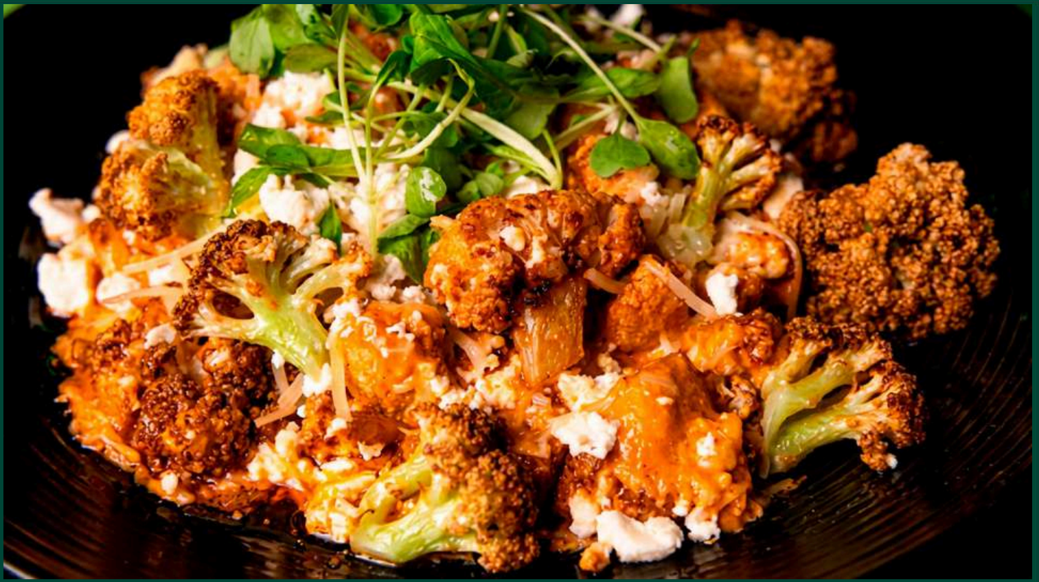
COLIFLOR CON TRUFA