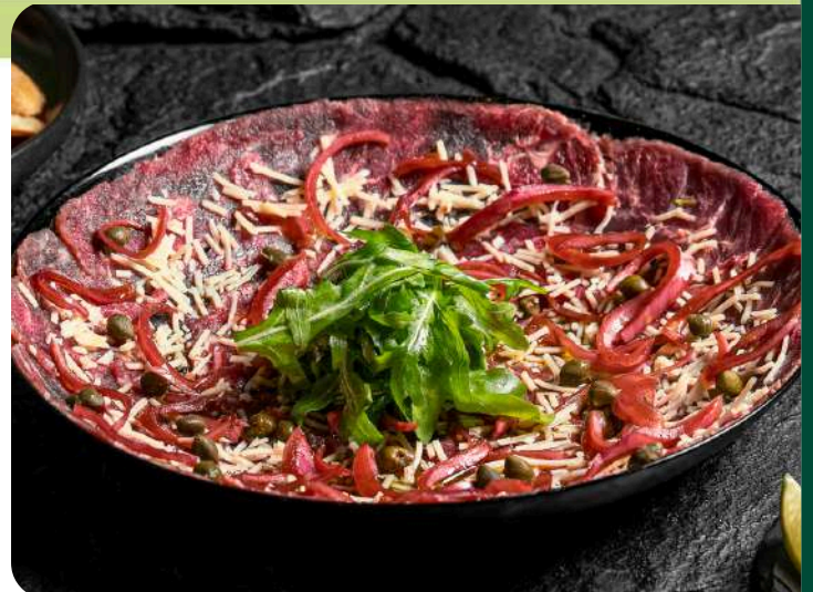
CARPACCIO DE RES