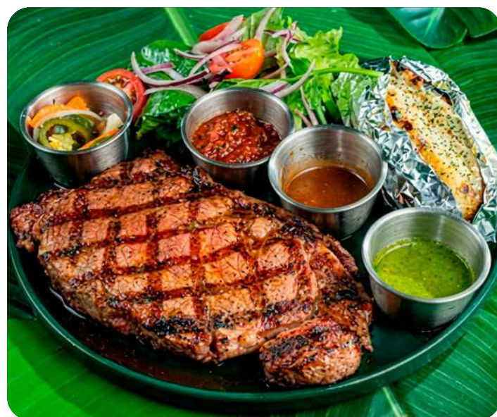
FILETE DE RES JURÁSICO

Incluye dos guarniciones a elección. 119