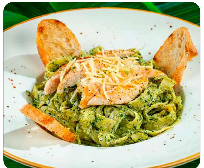
PASTA AL PESTO CON POLLO