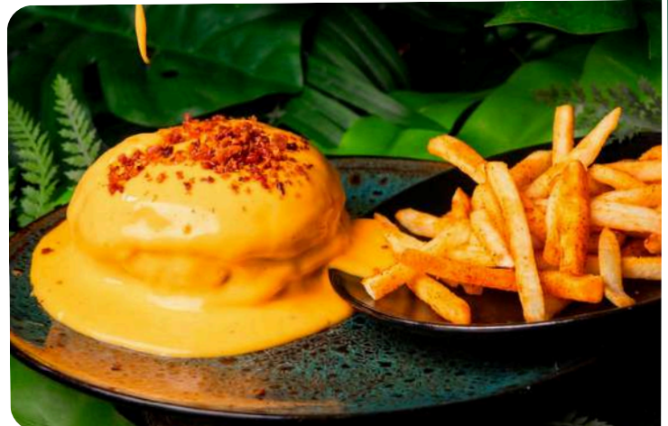
HAMBURGUESA VOLCÁN DE FUEGO