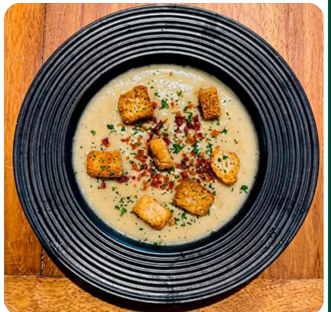
CREMA DE PAPA

La clásica del invierno, cremosa y cálida acompañada de trocitos de tocino y perfecta para sobrevivir la era glacial. 58