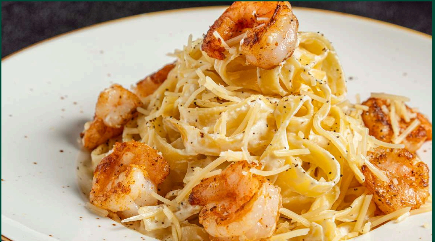
PASTA ALFREDO CON CAMARONES