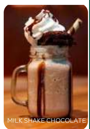
MILK SHAKE CHOCOLATE