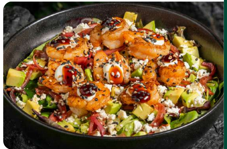
ENSALADA CON CAMARONES

Deliciosos camarones asados con un mix lechugas, aguacate cremoso y almendras fileteadas. Todo bañado con nuestra salsa de ostras y vinagreta especial. Fresca, exótica y tan sabrosa como un hallazgo del fondo del océano prehistórico. 98