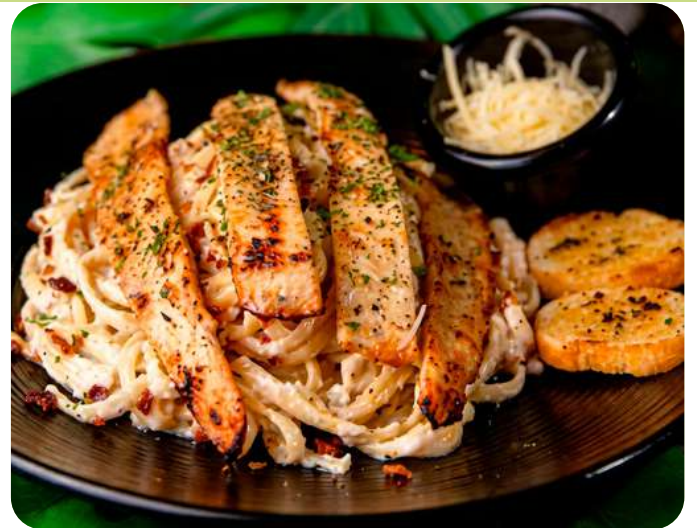
PASTA ALFREDO CON POLLO