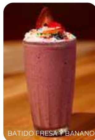
BATIDO FRESA Y BANANO