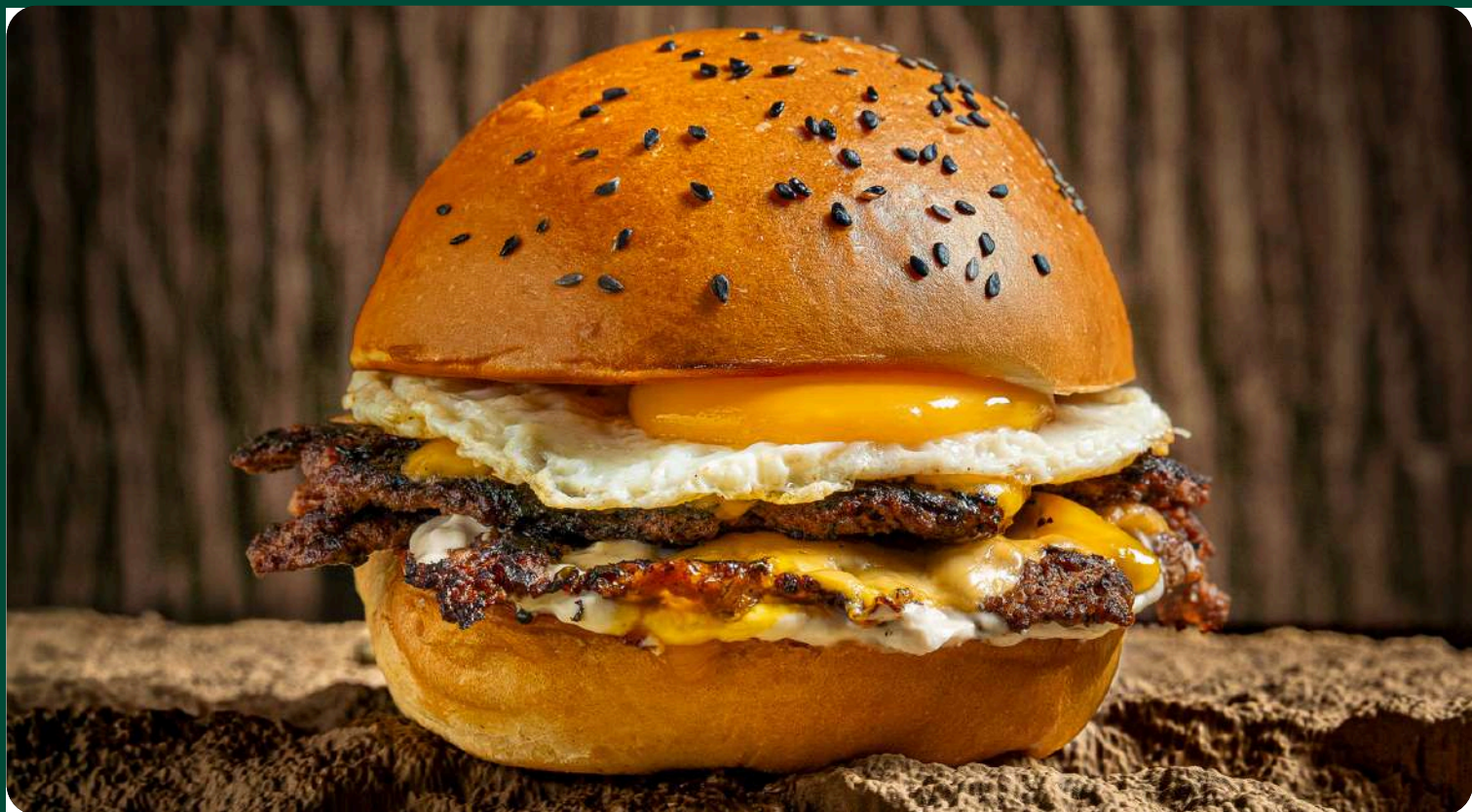
HAMBURGUESA T-REX DOUBLE SMASH TRUFA CON HUEVO