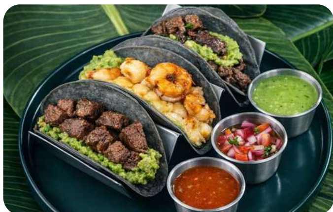
TACOS MAR Y TIERRA

Tacos dignos de un cazador del Mesozoico, succulento y jugoso lomito, puyaso y camarones salteados al fuego, servidos en tortillas suaves con guacamole, pico de gallo y nuestra salsa secreta jurásica. 109