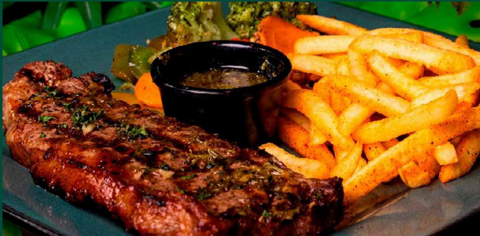
NEW YORK STEAK