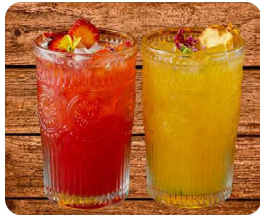
FRUTOS DEL BOSQUE | MANGO TROPICAL Y MARACUYA