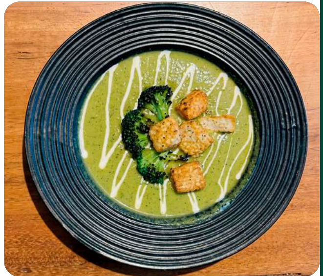
CREMA DE BRÓCOLI